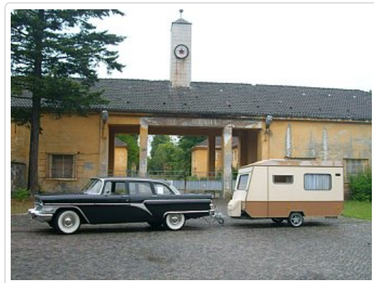
Auf der Website findet sich viel Wissenswertes und natürlich auch Anschauungsmaterial aus der Welt der Ost-Oldtimer

Mit ihrer Leidenschaft sind sie nicht allein. Zwischen März 2014 und Februar 2015 registrierte man auf der Vereinsseite 629.178 "Hits", also Seitenaufrufe. Für einen Klub mit recht spezifischen Interessenfeld ist das ein ordentliches Ergebnis.